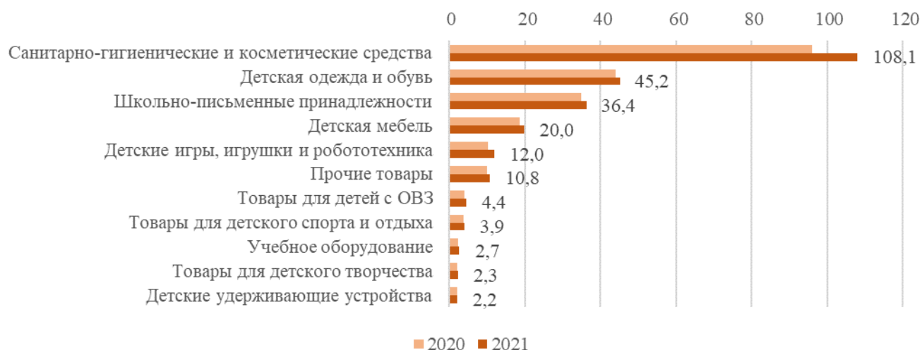
Прогноз производства товаров для детей в 2021 г., млрд руб.

Объем рынка товаров для детей в 2020 году составил 832 млрд рублей (2019 г. – 843 млрд рублей), при этом на 1 600 российских производителей пришлось 228 млрд рублей.