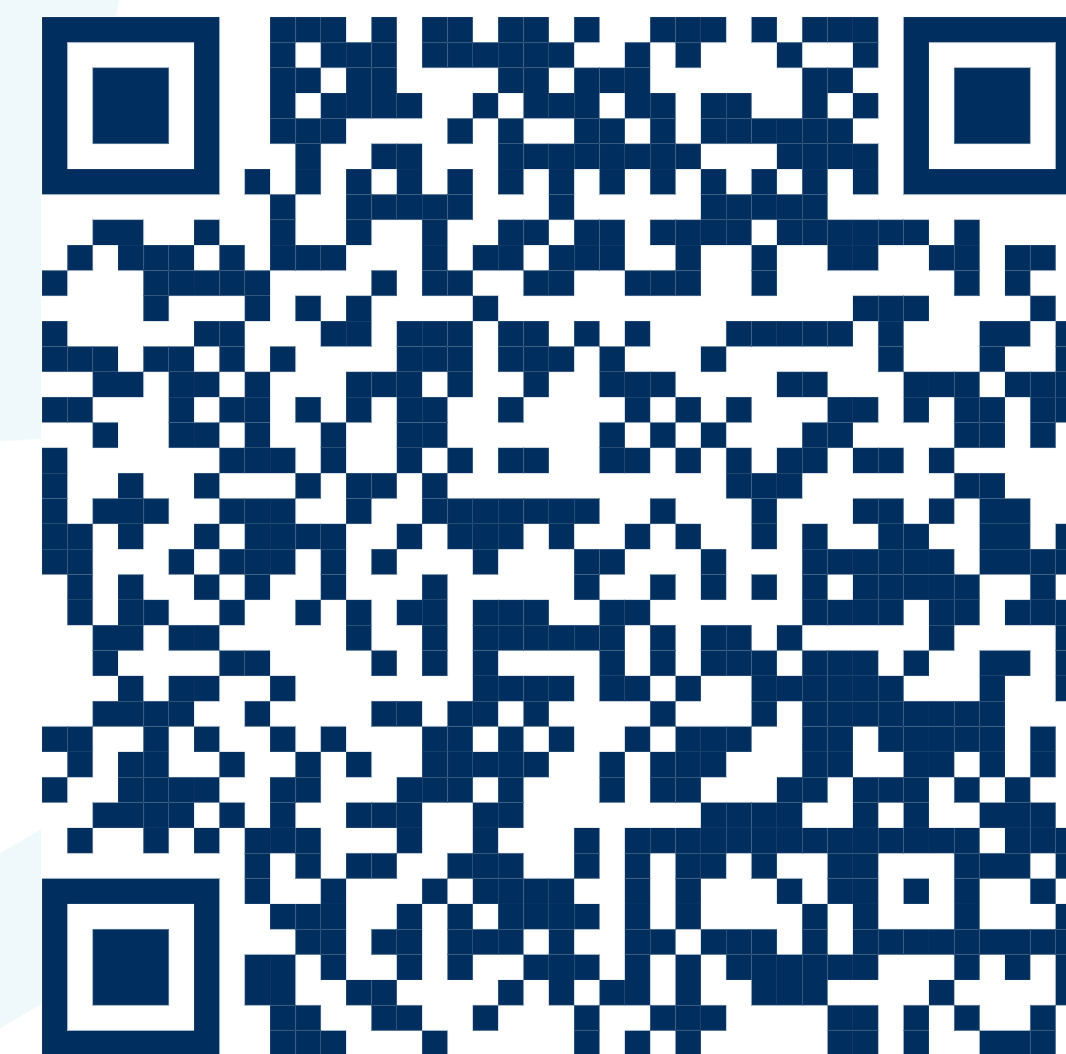
График семинаров на сайте РЭЦ